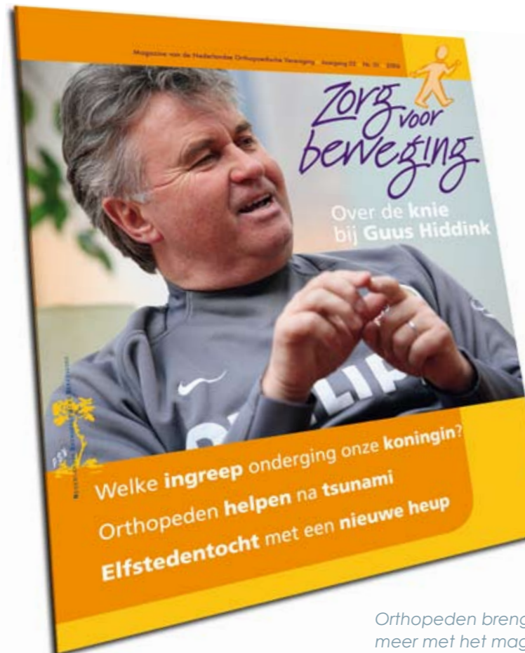
Orthopeden brengen hun werk onder meer met het magazine Zorg voor Beweging onder de aandacht.

Kijk voor meer informatie over de NOV en het vakgebied van de orthopeden op www.orthopeden.org of www.zorgvoorbeweging.nl .