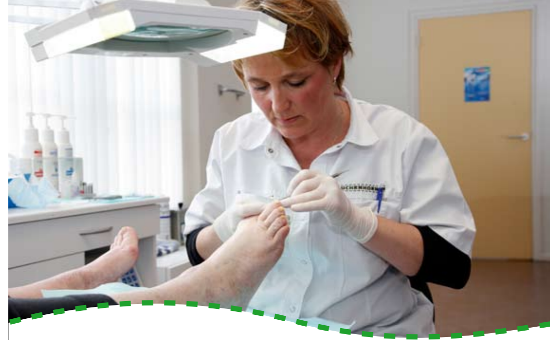
De vraag naar diensten van pedicures neemt nog steeds toe.