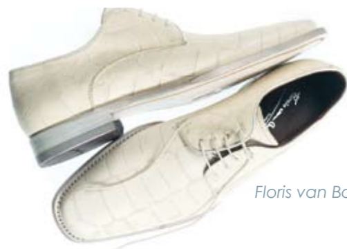
Floris van Bommel

Kleren maken de man of vrouw. Maar verwaarloos de rol van wat we aan onze voeten dragen niet. Want een outfit kan nog zo perfect gestyled zijn, de verkeerde schoenen erbij en het totaalbeeld zakt als een plumpudding in elkaar. Gelukkig heeft iedereen dat inmiddels goed in de gaten. Ook in de mode zijn schoenen geen ondergeschoven kindje meer, maar maken of breken ze juist het eindresultaat. Wie er volgens de laatste mode bij wil lopen, behoort dus ook op de hoogte te zijn van wat we, volgens de insiders, aan onze voeten moeten dragen.