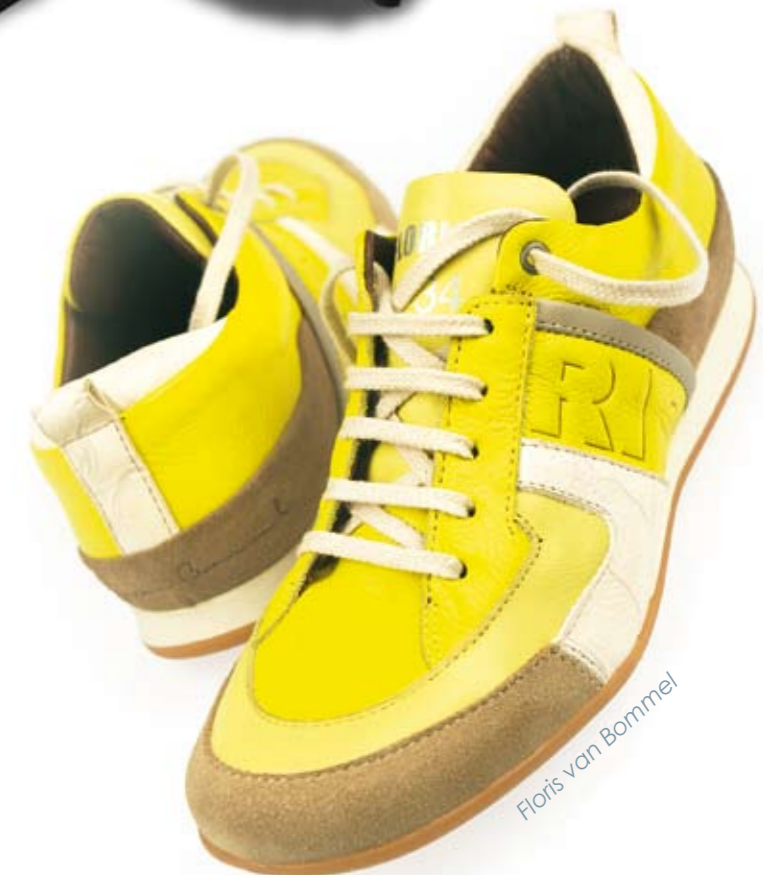
Floris van Bommel

Extra aandacht is er voor zolen. Hout, bamboe en kurk komen we dit voorjaar en deze zomer volop tegen aan de onderkant van de schoen. Maar ook de zolen van minder extreem materiaal, hebben een extra accent. Soms gaat het om een extra kleurtje. Een andere schoen toont een opvallend vormgegeven zool of zooldessin.